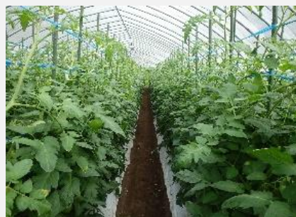
トマトほ場の様子（7月）