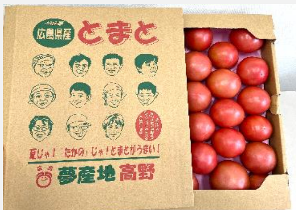
出荷されるトマト