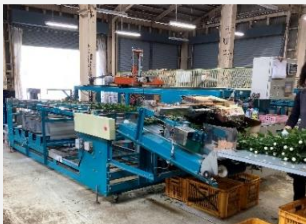
JA運営のキク選花場