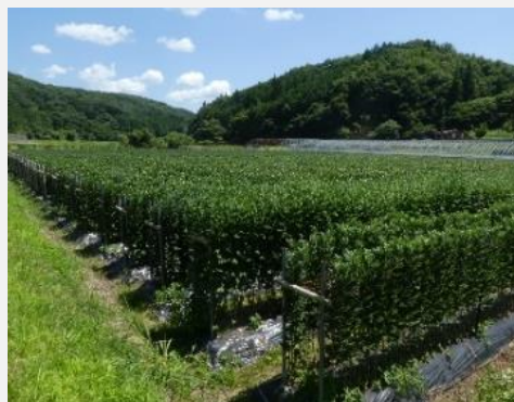
キクほ場の様子(7月上旬)