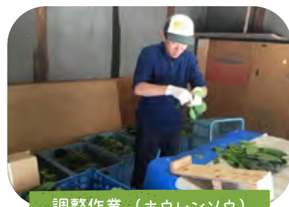
調整作業（ホウレンソウ）