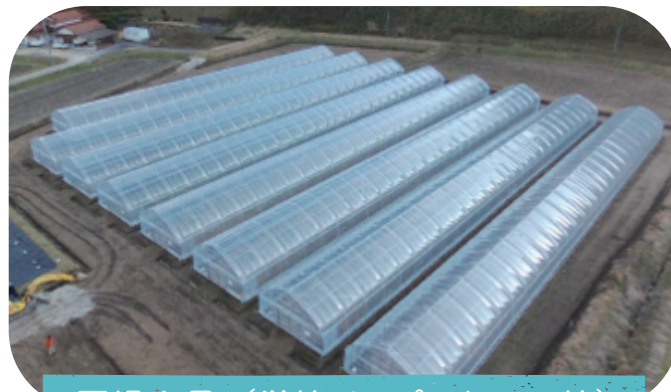
圃場全景 (単棟パイプハウス8棟)

なお、本農場の研修修了生は府中市上下町に就農することを前提としており、就農準備から就農後も関係機関が一体となり支援を行います。