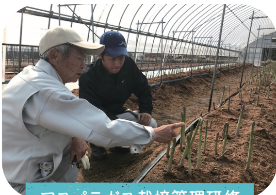
アスパラガス栽培管理研修