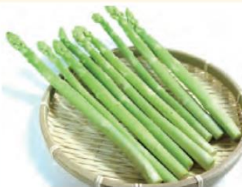
野菜 アスパラガス

ハウス栽培がおすすめ。3月末から10月上旬まで収穫します。たけのこのように土の中から生えてきたものを毎日収穫します。