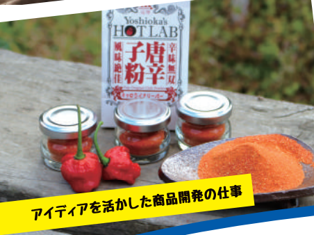
アイデアを活かした商品開発の仕事