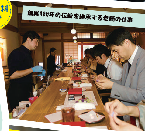
創業400年の伝統を継承する老舗の仕事

フェアでは、オンリーワン・ナンバーワン企業が集積している広島東部の新たに掘り起こした『とっておきの仕事』情報が盛りだくさん!尾道・福山・府中市を代表する経営者が語る広島東部ならではの働き方や暮らしについて直接聞けるフェアとなっております。広島県は、あなたにとってのナンバーワンの仕事さがしを丁寧にサポートします!会場でお待ちしています!