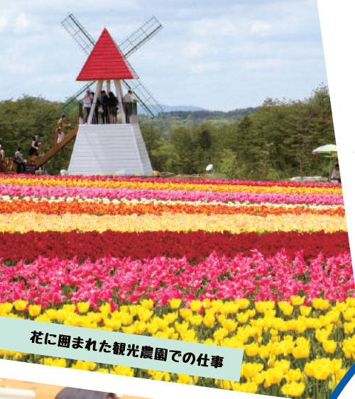
花に囲まれた観光農園での仕事