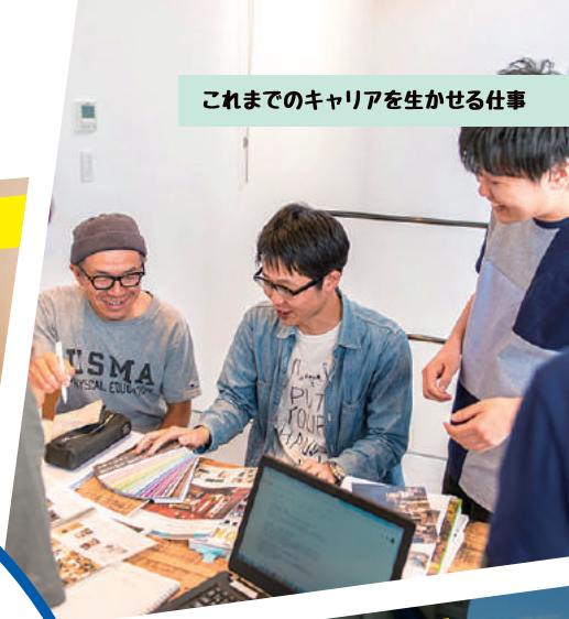
これまでのキャリアを生かせる仕事