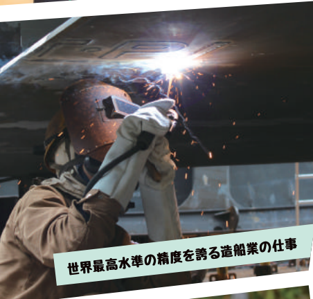
世界最高水準の精度を誇る造船業の仕事