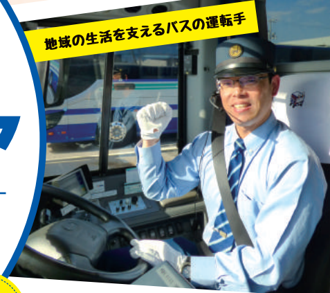
地域の生活を支えるバスの運転手