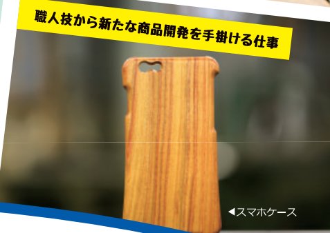
職人技から新たな商品開発を手掛ける仕事