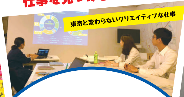
東京と変わらないクリエイティブな仕事