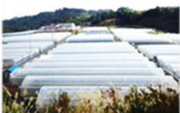
陽光の里トマト団地全景