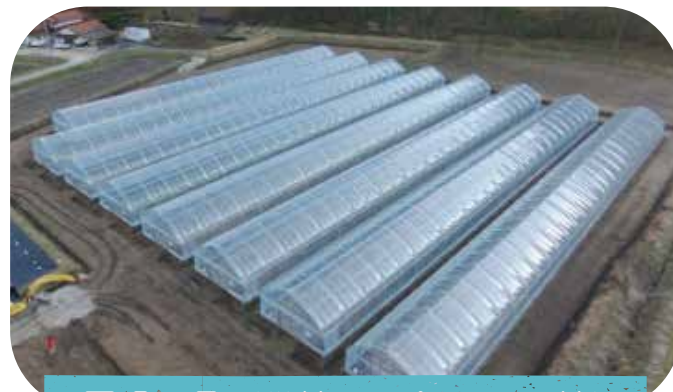
圃場全景 (単棟パイプハウス日棟)

なお、本農場の研修修了生は府中市上下町に就農することを前提としており、就農準備から就農後も関係機関が一体となり支援を行います。