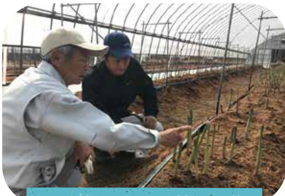
アスパラガス栽培管理研修