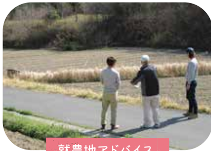
就農地アドバイス